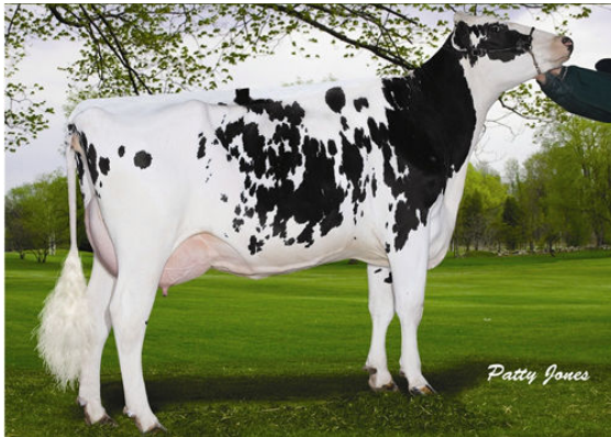
MTN-VIEW-S PT BUBBLE Dam